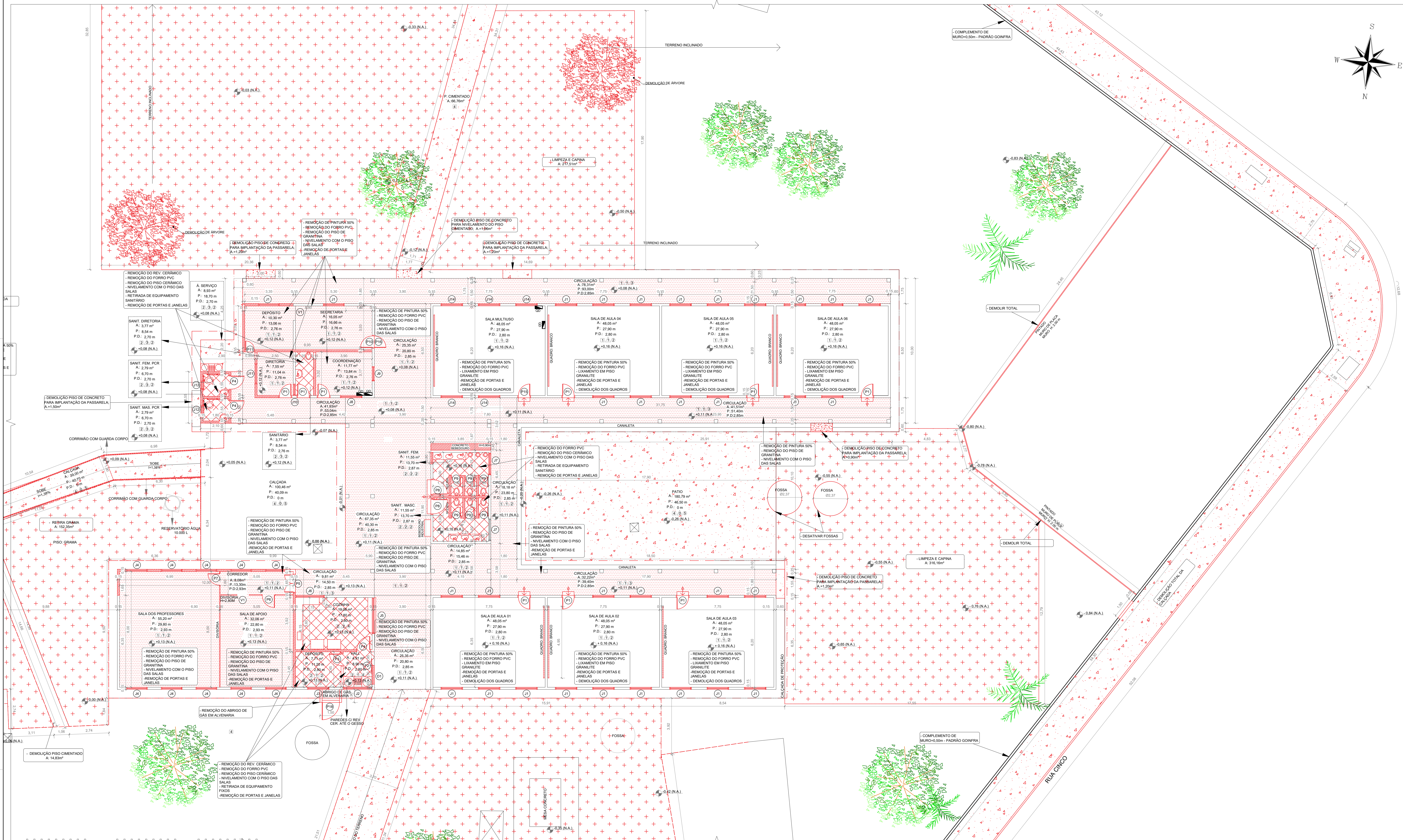
PLANTA BAIXA - DEMOLIÇÃO PARTE 03 ESCALA 1:100